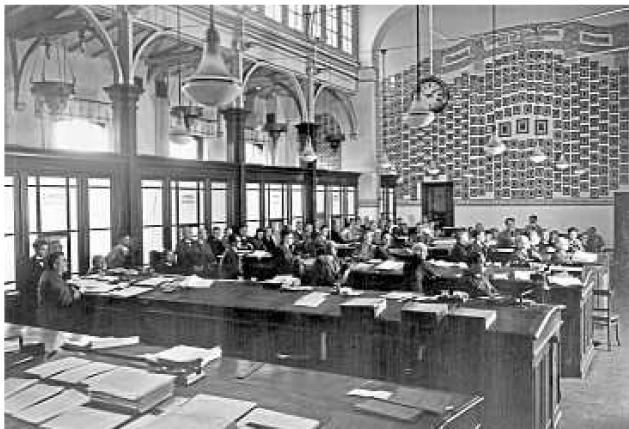
Büro der Lohnbuchhaltung in Wuppertal-Elberfeld. Hinten an der Wand hängen Fotos der Jubilare.